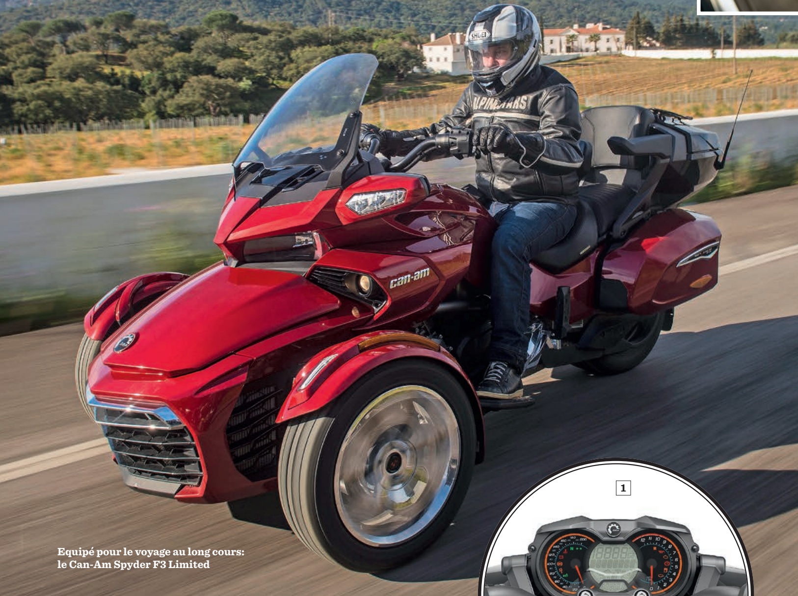
Équipé pour le voyage au long cours: Le Can-Am Spyder F3 Limited

Il n'y a pas que les motos! Sur trois roues aussi on peut se faire plaisir. Les nouveaux Spyder F3 de Can-Am proposent une motorisation revue, un look plus sportif et un châssis plus rigoureux.